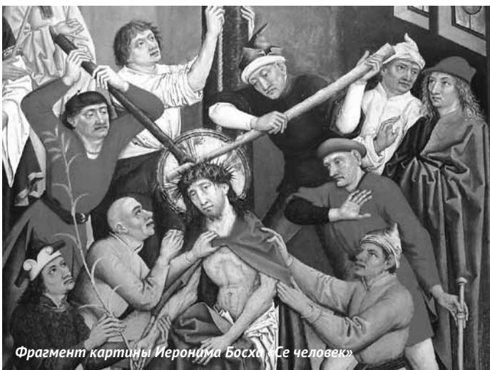
Фрагмент картины Иеронима Босха «Се человек»

Потому о религии и говорят как о вере, а не как о знании и науке. Подвиг веры заключается в доверии Божественному Промыслу и в уверенности, что в конечном итоге все, даже самые тяжелые страдания послужат во благо: Претерпевший же до конца спасется (Мф 10:22). Ф.