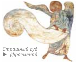
Страшный суд (фрагмент).

На самом деле: Конец света в христианском понимании предполагает двойное к нему отношение. Те, кто не захочет принять спасение от Христа, будут ... издыхать от страха и ожидания бедствий, грядущих на вселенную (Лк 21:26) . Тем же, кто сохранит веру, Христос говорит: Когда же начнет это сбываться, тогда всклонитесь и поднимите головы ваши, потому что приближается избавление ваше (Лк 21:28) . Одни и те же признаки приближающегося финала человеческой истории будут действовать на людей совершенно по-разному. Для одних эти приметы станут причиной страха, уныния и жестоких страданий. Для других — радостным известием о скором прекращении всех бед и несчастий человечества и наступлении новой эры в истории этого мира. От нас требуется лишь определиться, в чьем стане мы хотим оказаться, если доживем до последних времен. Потому что даже Всемогущий Бог не может спасти нас без нашего согласия. ■