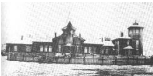
Бежецк. Здание вокзала. Начало XX в.