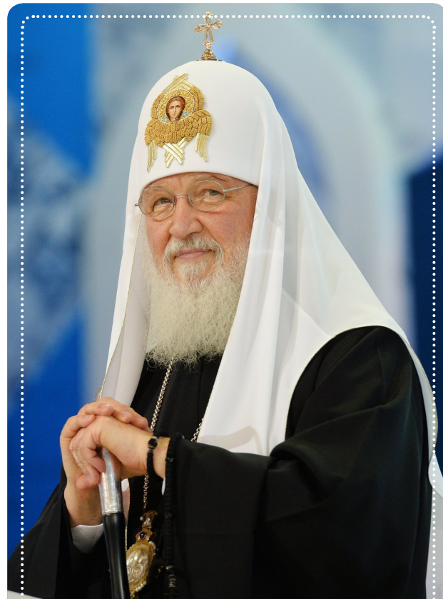
Святейший Патриарх Московский и всея Руси Кирилл