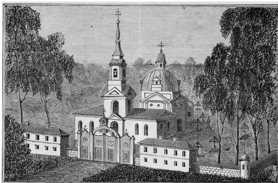
Вид Кладбищенской Спасской церкви в городе Бежецке, Тверской губернии. Литография.

Издравле он состоял приписным к Собору; богослужение же в нем управляли в праздники соборные, а в простые дни приходские от шести церквей поочередно священнослужители. Таковое положение храма неблагоприятно отзывалось на его благосостоянии и не могло удовлетворять религиозному требованию граждан, которые в большинстве не имели возможности помолиться на прахе родителей, когда бы хотелось; потому издавна среди граждан существовало желание иметь на кладбище своего священника. По сему случаю бывший староста Кладби-