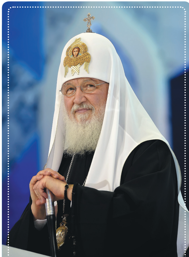
Святейший Патриарх Московский и всея Руси Кирилл

Информационная служба Бежецкой епархии (по материалам Пресс-службы Патриарха Московского и всея Руси)