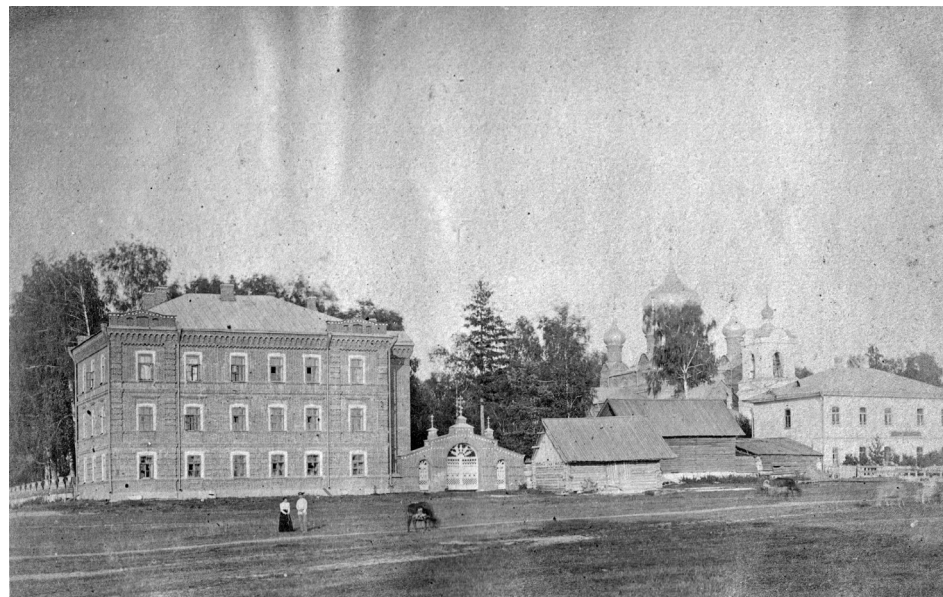
Вид Спасского Кладбищенского храма в Бежецке. Не позднее 1902 года (до постройки новой колокольни).

богатства в руках своих (Псал. 75. 6), которым отказано и в одной капле воды, чтобы устудить язык их (Лук. 16. 24). Наконец и нас, остающихся в живых, неминуемо ожидает тот день, в который должны будем расстаться с белым светом: нас положат с отцами нашими; родные и друзья оплачут нас, опустят в могилу — и разойдутся восвояси. Тогда Св. Храм, как Ангел Хранитель, останется духовным стражем над могилами на-