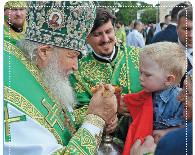
Святейший Патриарх Московский и всея Руси Кирилл