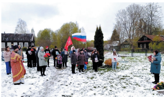
Пасхальным чином и обратился к собравшимся со словом проповеди.