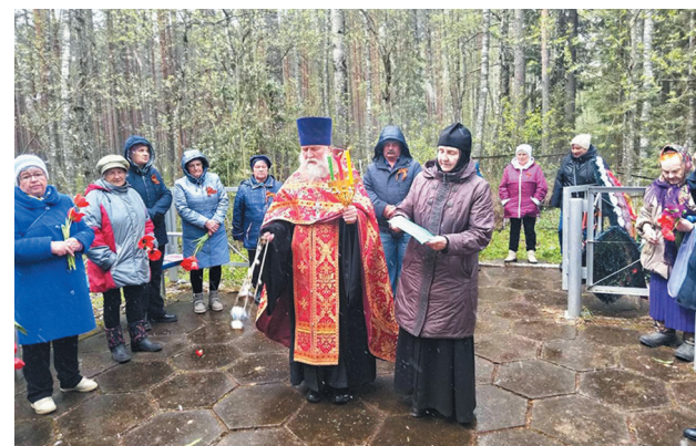
В памятных мероприятиях, посвященных 79-й годовщине Победы в Великой Отечественной войне, которые состоялись в населенных пунктах Удомельского городского округа, участвовали клирики Удомельского благочиния. ■