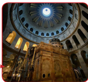
Храм Воскресения Христова (Гроба Господня).

Почти сразу Крест был разделен: одну часть царица Елена поместила в серебряный ковчег и оставила в Иерусалиме, а вторую отправила в Константинополь. Паломники, приезжавшие в Иерусалим, мечтали забрать частичку святыни с собой. Так уже в IV веке частицы Креста Господня разошлись по всей земле. Чтобы сохранить святыню от расхи-