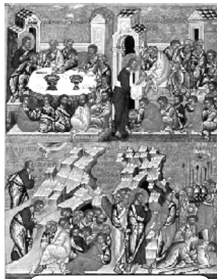
Тайная вечеря, Омовение ног, Моление о чаше, Предание Иуды

проклинается сребролюбие и предательство Иуды.