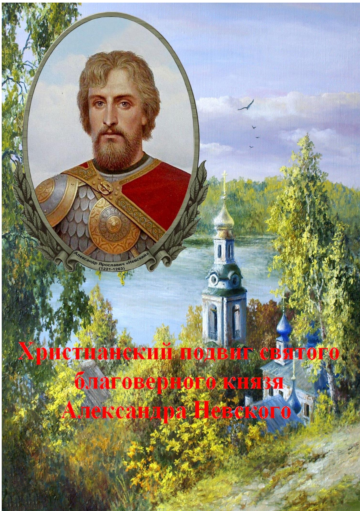
Александр Ярославич «Невский» (1221-1263)