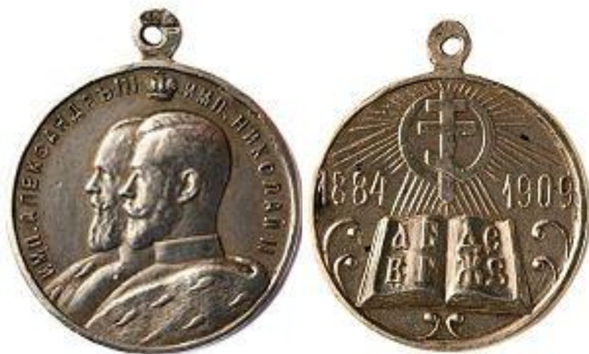
Медаль Орлова А.Ф. за просветительскую деятельность и служение в церковно – приходских школах.